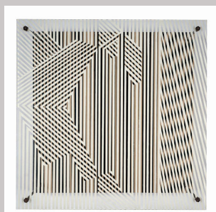
FOTOGRAFÍA. COLECCIÓN FUNDACIÓN BANCO MERCANTIL. 2017

Estado: BOLÍVAR / Municipio HERES Ciudad: Ciudad Bolívar Categoría: BOLÍVAR Subcategoría: Municipio HERES , Escultor , Pintor , Cronología: Siglo XX